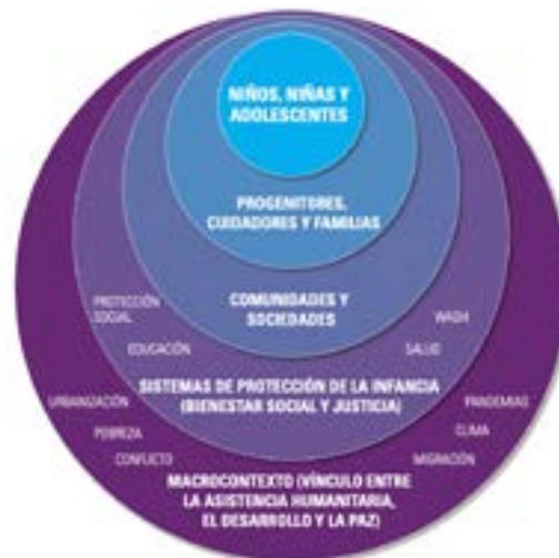
Imagen 1: Marco de referencia para el bienestar de la niñez, Unicef (2025) 4

Esta mirada ha sido incorporada expresamente en la Política y Plan de Acción Nacional de Niñez y Adolescencia 2024–2032, elaborada bajo la Ley 21.430, la cual determina que “el bienestar de niños, niñas y adolescentes es multinivel y sensible a las distintas etapas del desarrollo en que se encuentran” 5 . El marco conceptual subraya que el bienestar se construye a través de las interacciones que cada persona experimenta en su familia, escuela, grupo de pares y comunidad, entornos desde los cuales internaliza creencias, normas y patrones de comportamiento 6 . Cuando estas interacciones se manifiestan de forma positiva y orientada al bienestar, actúan como factores protectores que inhiben riesgos. De lo contrario, el contexto se convierte en una fuente de vulnerabilidad que compromete el desarrollo integral. Ello implica reconocer que las intervenciones más efectivas son aquellas que actúan simultáneamente en distintas dimensiones, considerando las particularidades de cada etapa del curso de la vida —gestación y nacimiento, primera infancia, infancia media y adolescencia— y las necesidades específicas que cada una presenta para garantizar un desarrollo óptimo e integral.